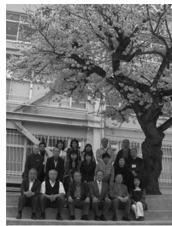
満開の桜の下 HCD 役員集合